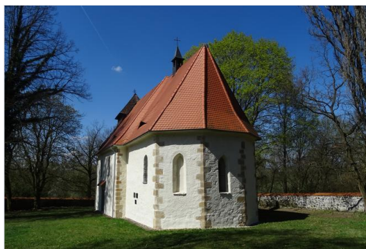
Kostel sv. Ambrože u Přeštic

Cena za ubytování se snídaní – 1.600,- Kč dospělí, 900,- Kč děti.